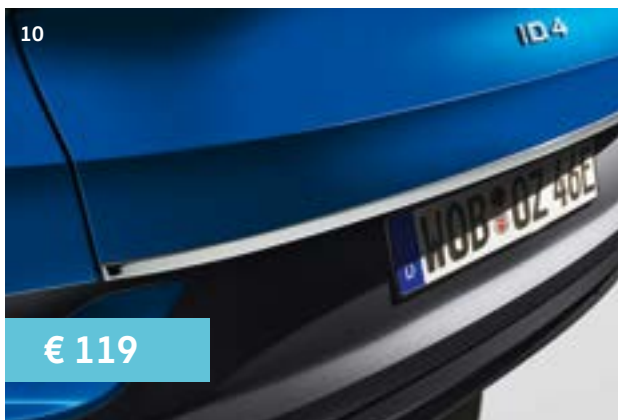
10 Chromen sierlijst voor op de achterklep. Art.nr. 11A071360