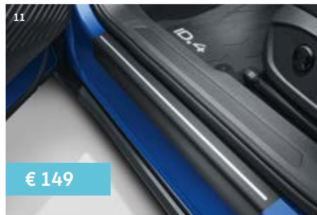
11 Instapfolie. Bescherm de dorpels met instapfolie (zwart/zilver). Art.nr. 11A071310 ZMD